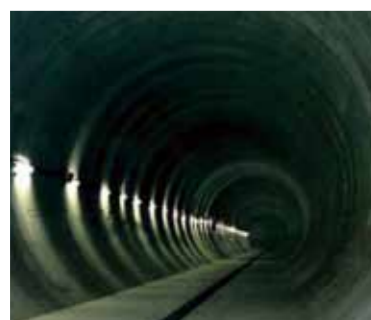
完成当時の内部写真