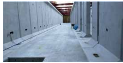
施工中の内部写真

そこで浸水被害の軽減を図るため、昨年度、伊丹小学校敷地内北側の地下に雨水を1,500m 3 まで貯留できる施設を整備しました。