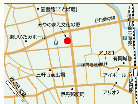
③みやのまえ文化の郷付近