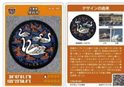
現行デザインのマンホールカードの表と裏

マンホールカードとは下水道広報プラットフォームが地方公共団体の申請を受けて登録・発行しているカード型下水道広報パンフレットです。