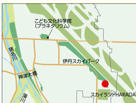
①スカイパーク南駐車場管理棟付近

3種類のデザインマンホールをそれぞれデザイン由来の地へ令和3年1月以降に設置します。設置場所は下記のとおりです。ぜひお立ち寄りください。