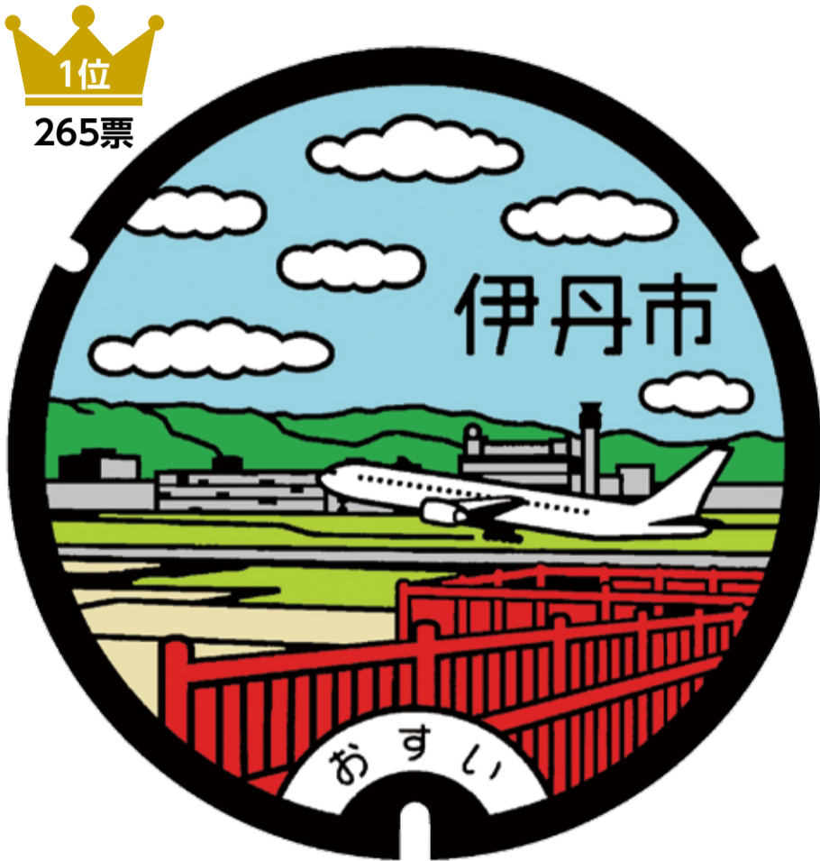
①大阪国際(伊丹)空港・伊丹スカイパーク