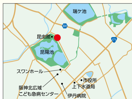
②昆虫館東側入口付近