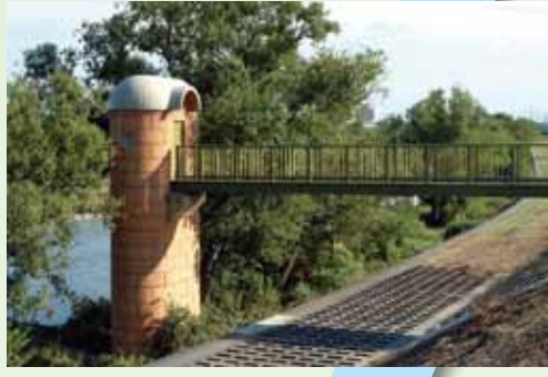
北村取水塔(猪名川)