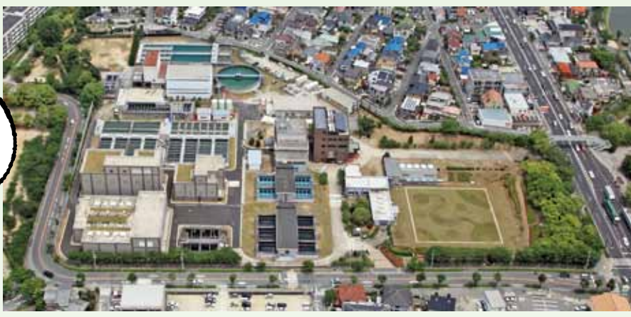
千僧浄水場 (敷地面積約 37,000㎡)