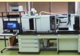
かび臭物質測定装置

皆さんのご家庭に水を届けるため、千僧浄水場は24時間365日休むことなく浄水処理を続けています。2005年にはそれまでの沈でん・ろ過処理方法にオゾン処理と活性炭処理を加えた高度浄水処理を導入しました。その結果、かび臭物質の濃度が15分の1以下まで減少し、異臭味を感じるものがほとんどなくなりました。また、消毒のために加えている塩素濃度も半分以下まで減らすことが可能となり、今まで以上においしい水を作ることができるようになりました。