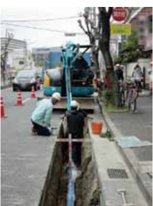
耐震管への更新工事の様子

千僧浄水場で浄水処理された水は、道路に埋設している水道管を通して皆さんのご家庭に届けられます。古くなった水道管は、管の破裂や管内部のサビによる赤水の発生要因となっていることから、計画的に新しい管に入れ替えています。さらに、地震に強い管(耐震管)にすることで管路の強化も図っています。工事の際には交通規制などのご迷惑をおかけしますが、ご理解をお願いします。