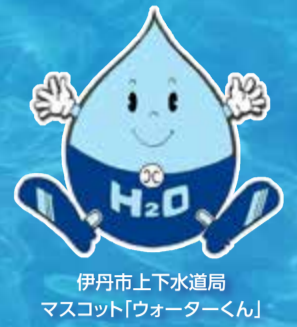
伊丹市上下水道局 マスコット「ウォーターくん」